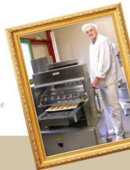
Biscuiterie de Sologne